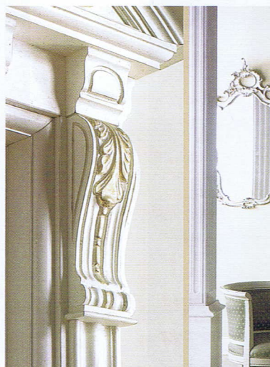
Фабрика New Design Porte, модель Bastiglia, Италия (Галерея дверей «КВАДРО»)